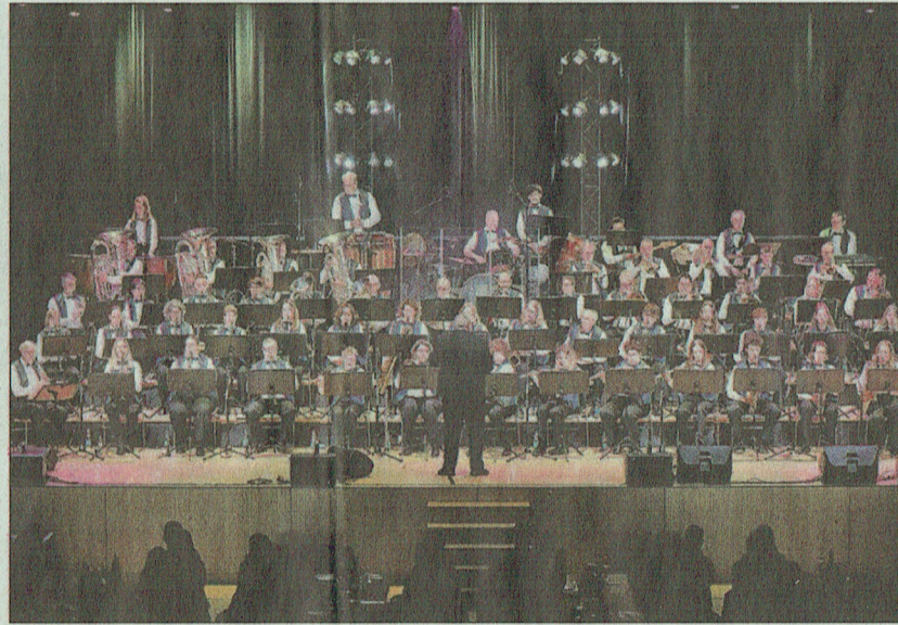
Das Orchester in seiner ganzen Pracht.